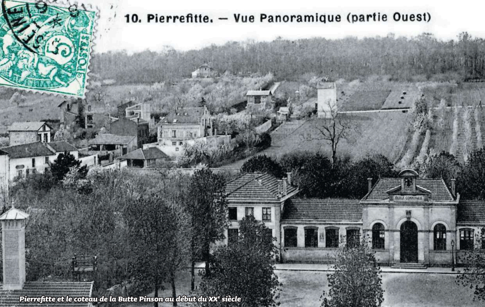
Pierrefitte et le coteau de la Butte Pinson au début du XX e siècle