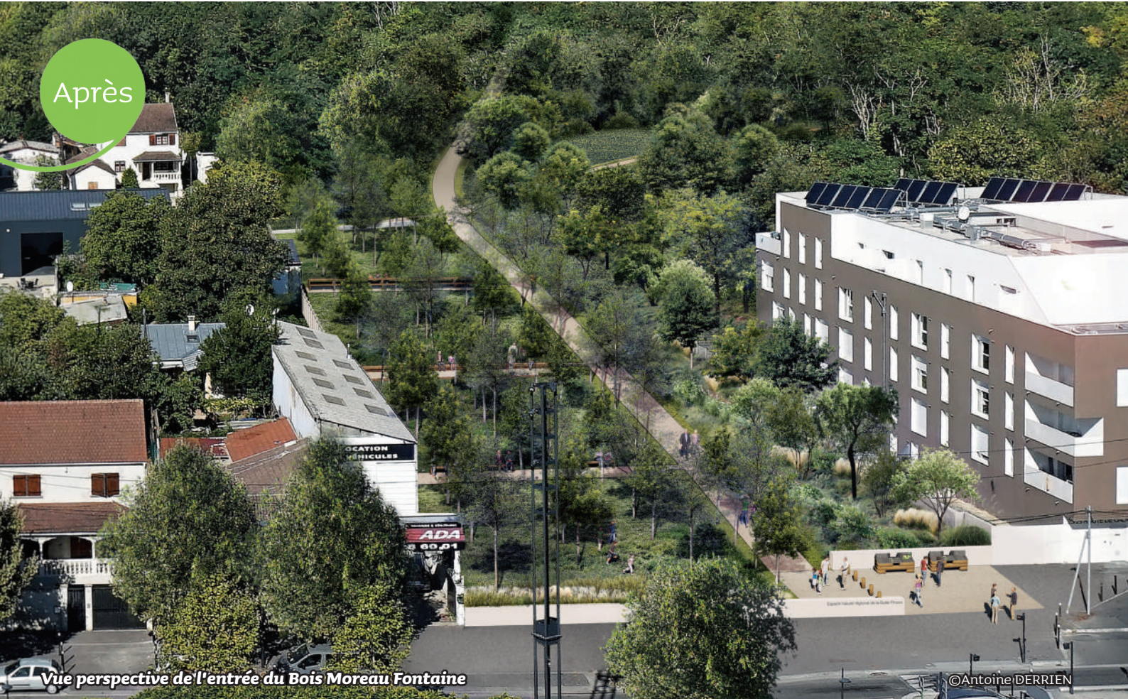
Vue perspective de l'entrée du Bois Moreau Fontaine