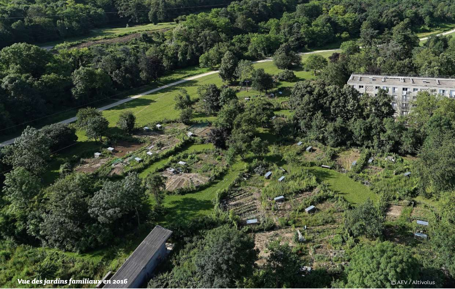
Vue des jardins familiaux en 2016