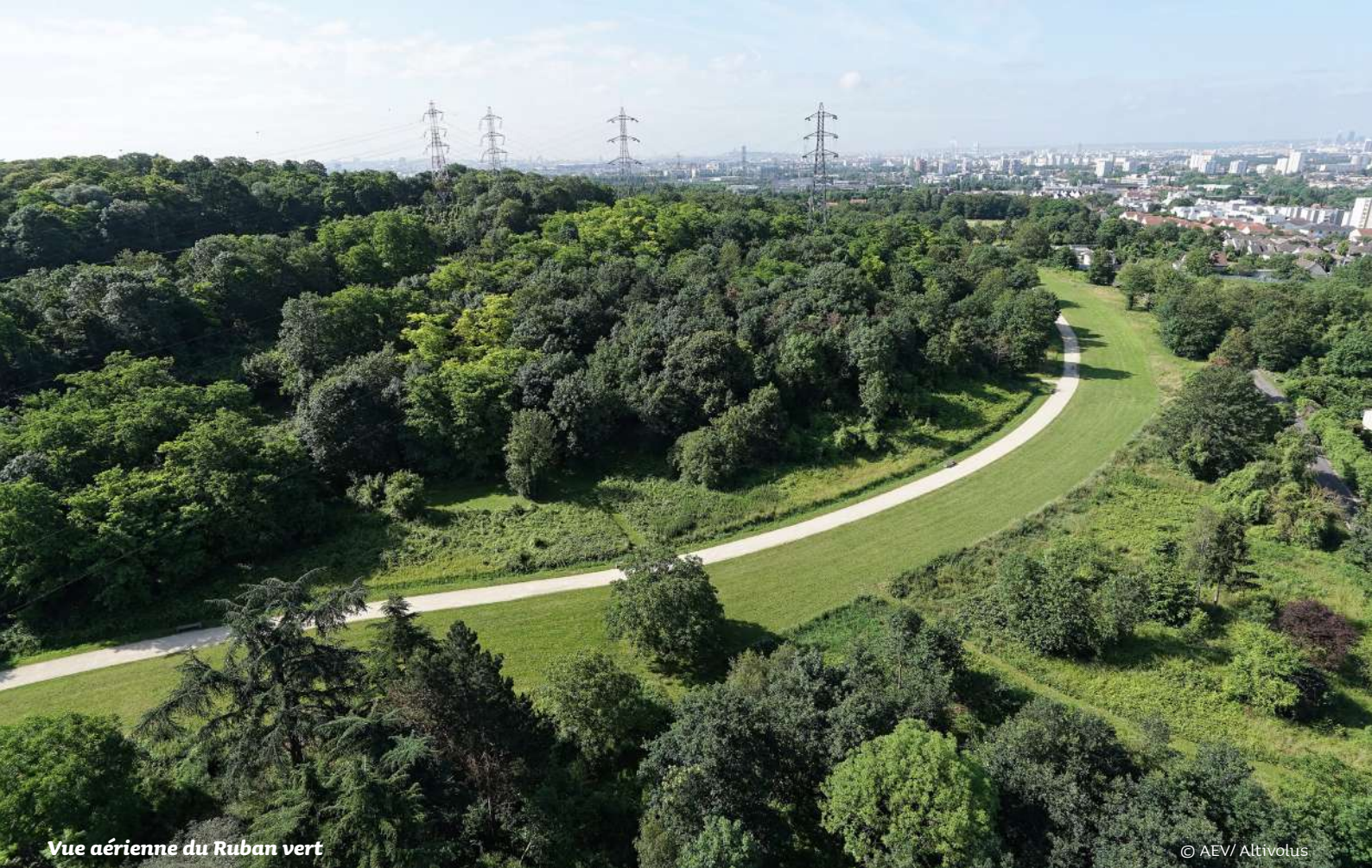
Vue aérienne du Ruban vert