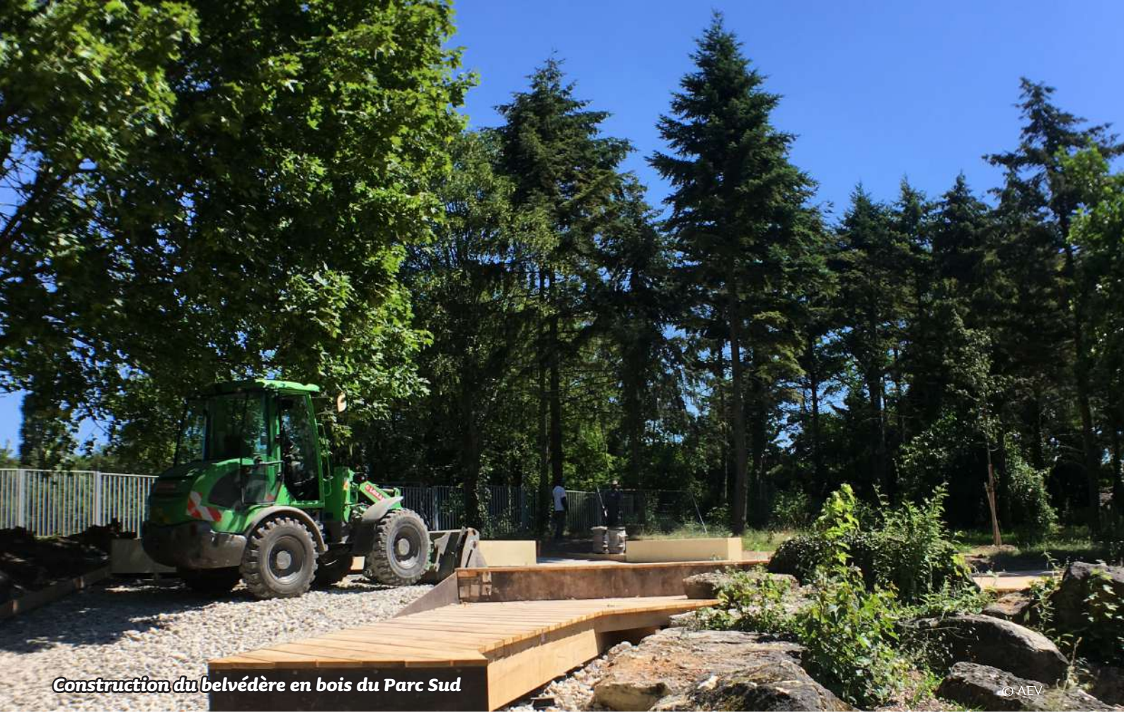
Construction du belvédère en bois du Parc Sud