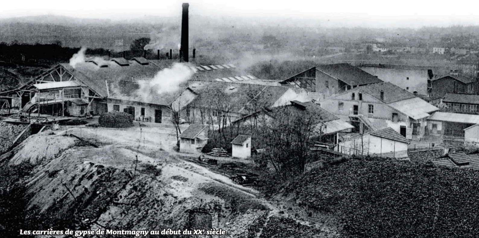
Les carrières de gypse de Montmagny au début du XX e siècle